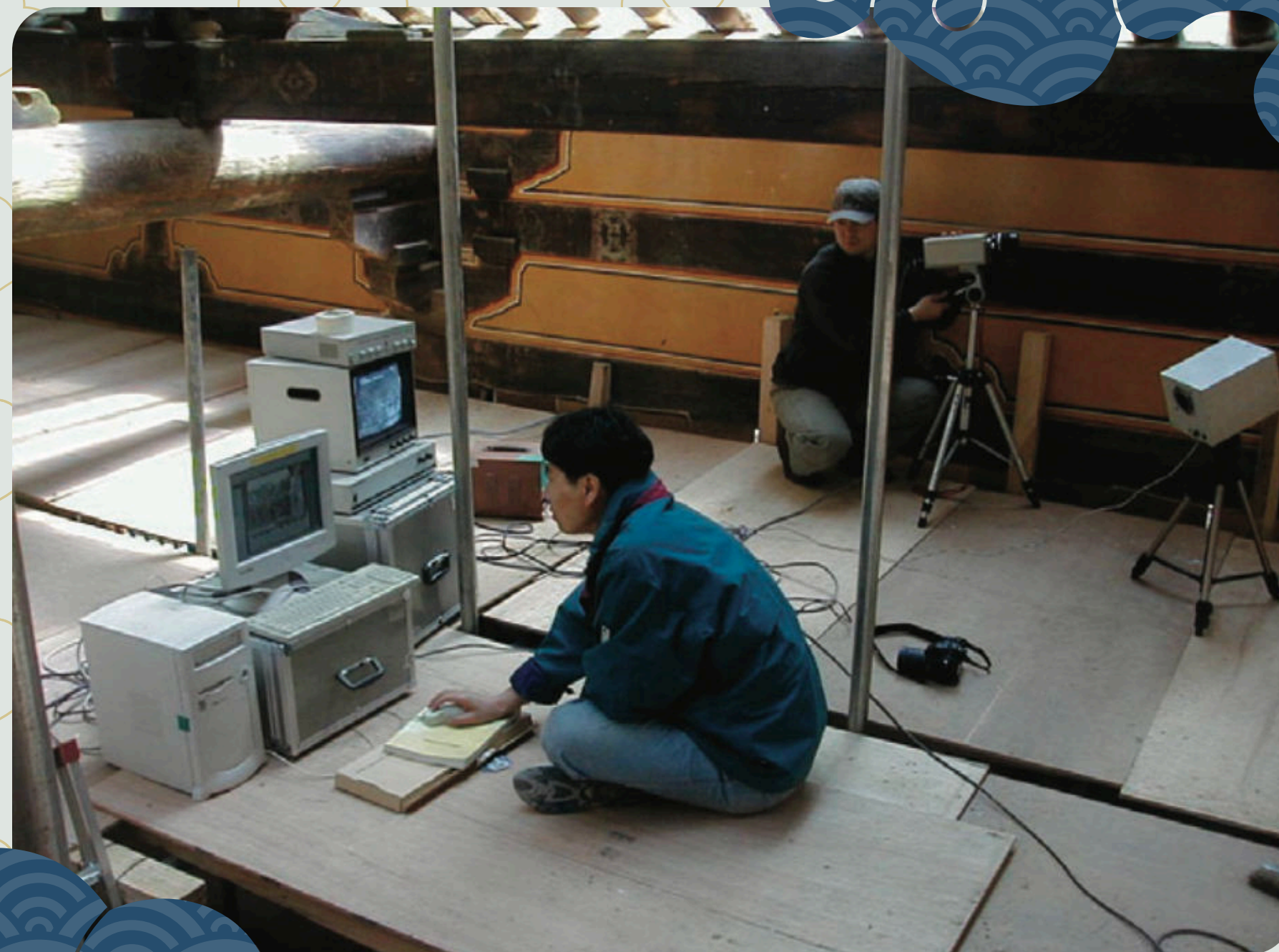
L'IRR nel sito di restauro

Si è deciso di utilizzare l'IRR per esaminare i dipinti sbiaditi o coperti da altro, l'IRR è una tecnica di acquisizione di immagini digitale non distruttiva che catturano e assorbono le radiazioni tra i 750 e 2000 nanometri, la tecnica è semplice ed efficace ed è perfetta per trovare disegni sbiaditi o nascosti. Lo strumento è costituito da 3 componenti: un emittente di infrarossi, un detector e un computer. Lo strumento è posizionato a 2 metri di distanza dall'oggetto e cattura la luce riflessa, il computer mostra le immagini, sono state scattate fotografie convenzionali per fare le comparazioni; L'IRR può trovare facilmente il pigmento nero, il bianco, il marrone, e il rosso.