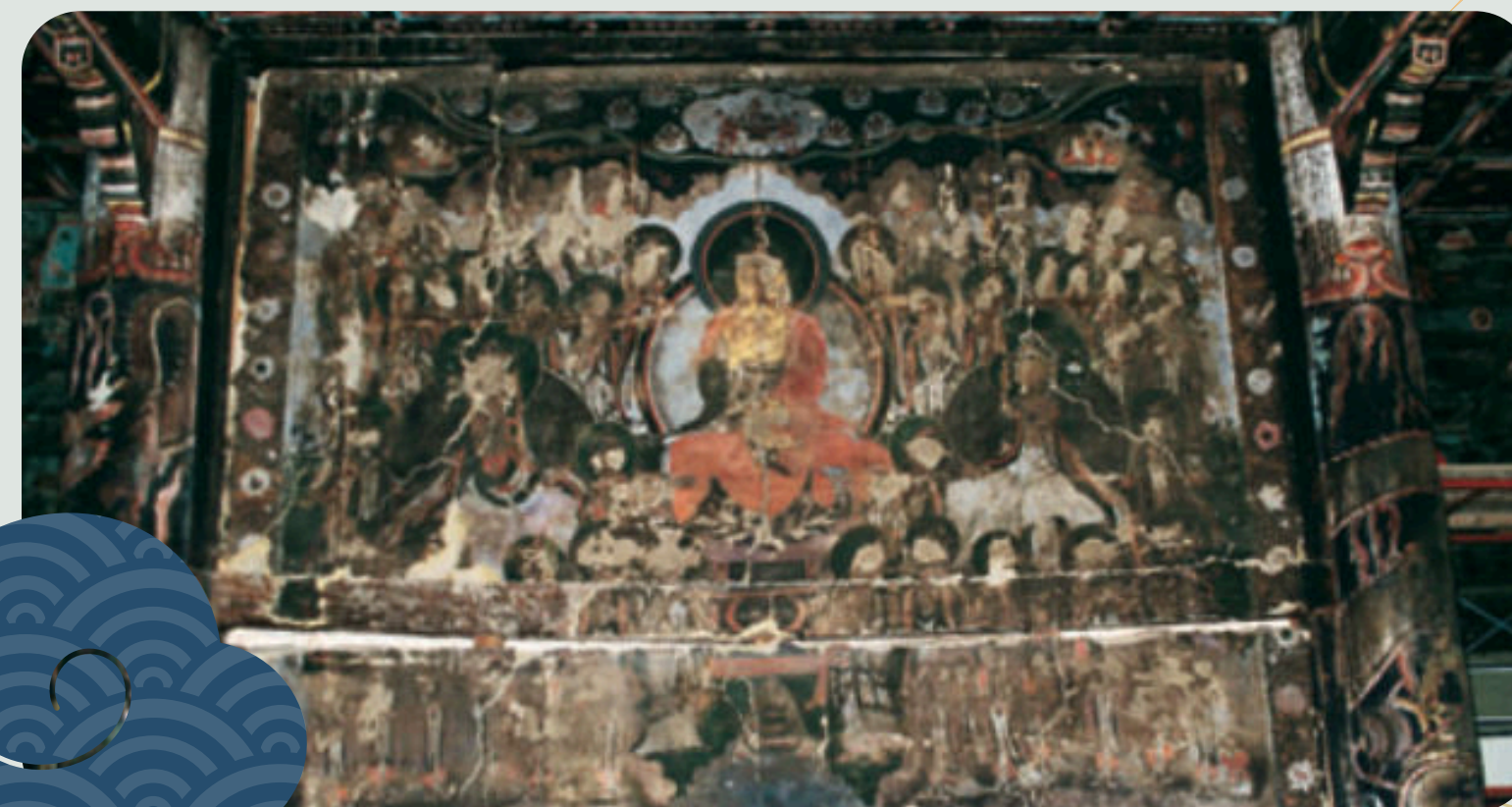
Un dipinto buddista durante il restauro