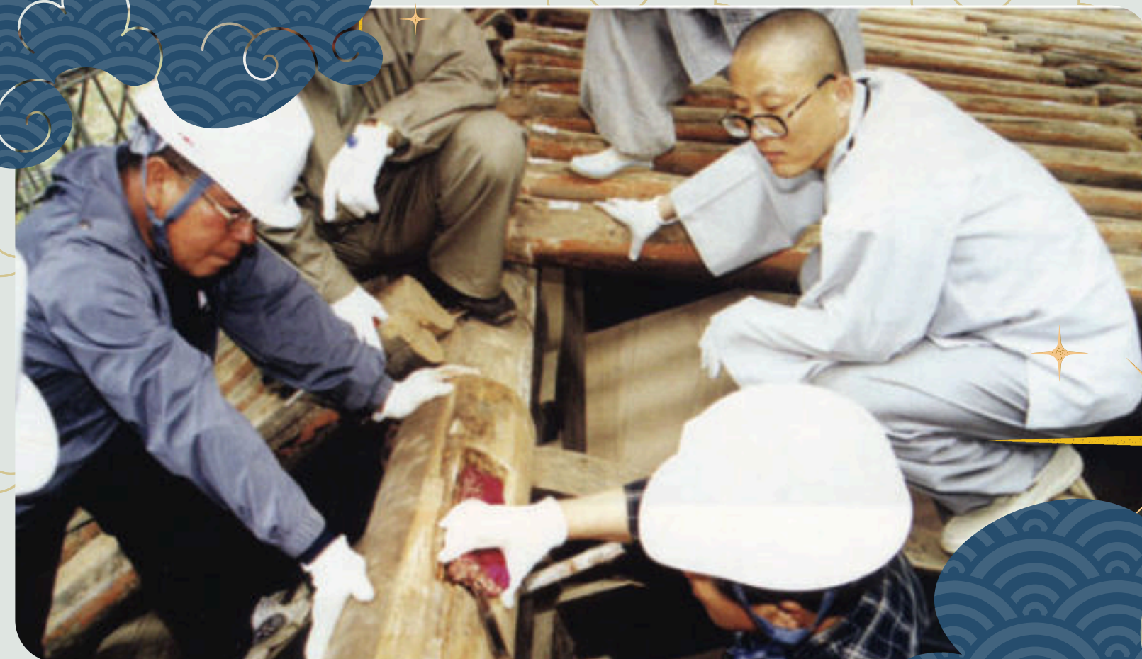
Un monaco presente per il posizionamento della prima trave