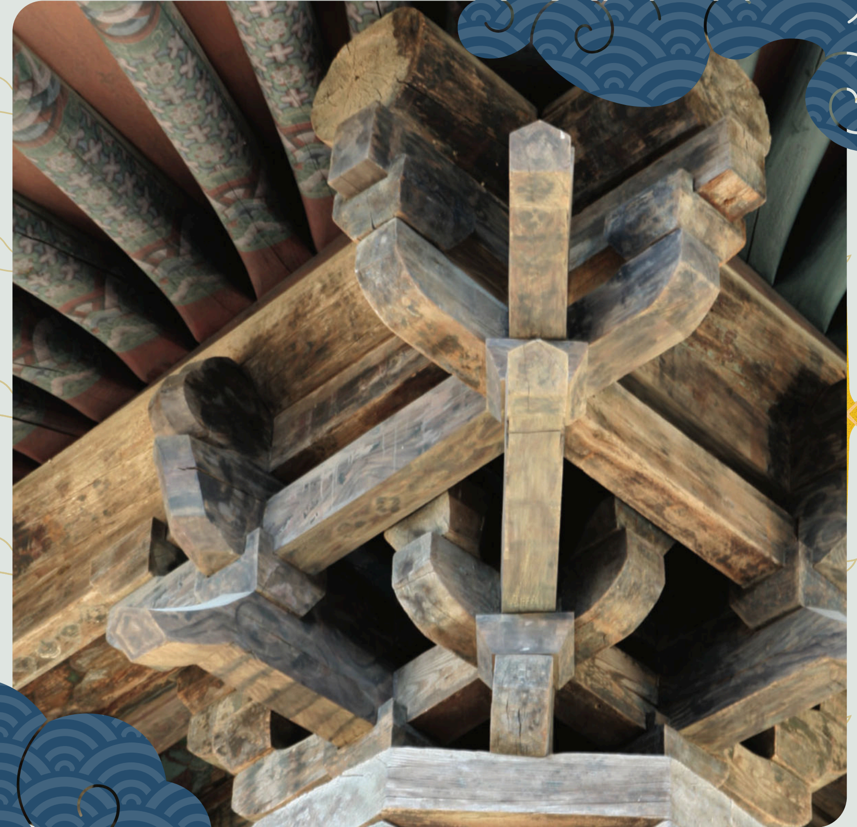
Dettaglio del Tempio di Hall of Paradise

Molte decorazioni originali sono state coperte da altri dipinti, oscurando un importante prova storica.