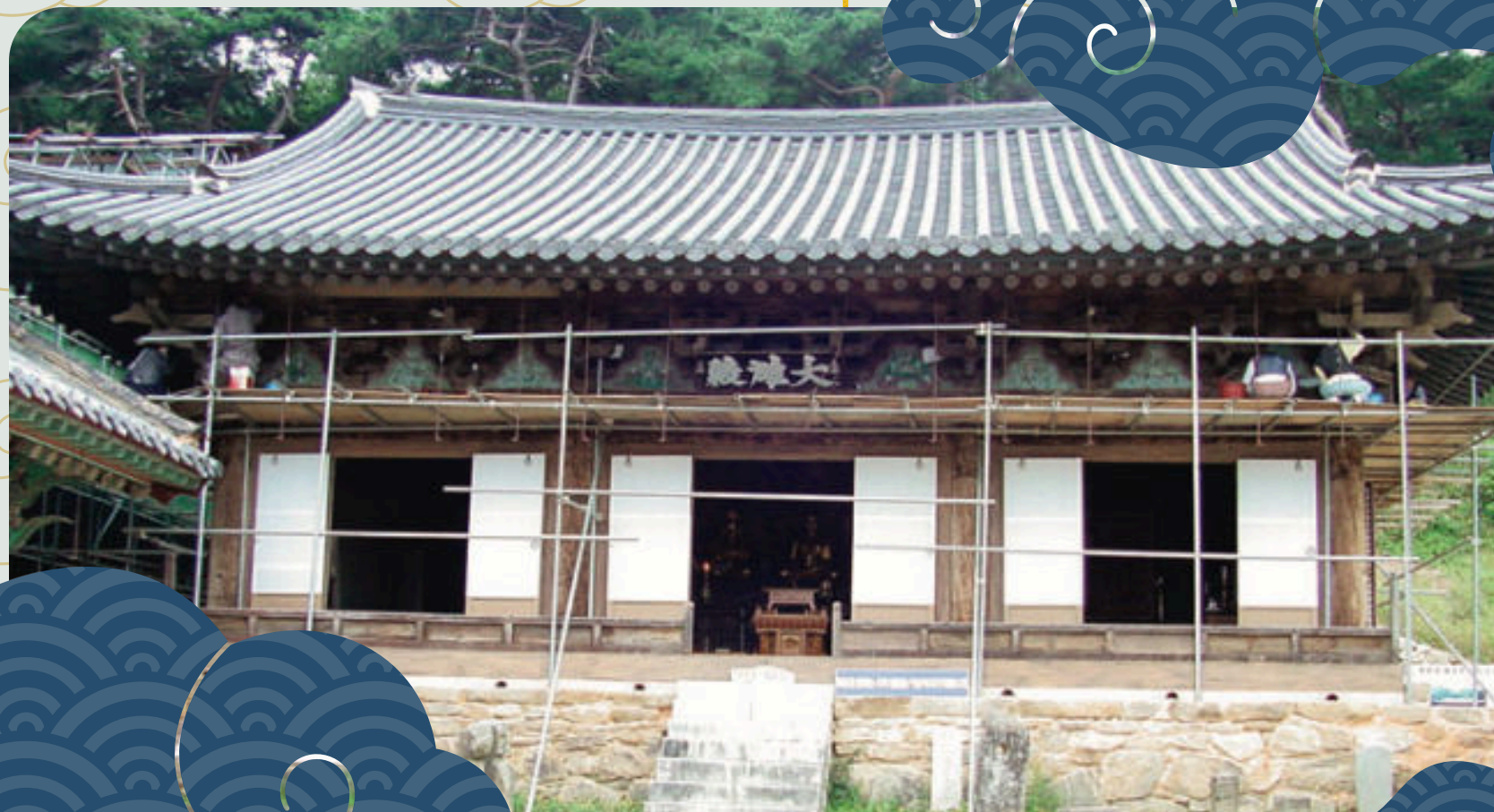
Il tempio dopo la ricostruzione del 2002